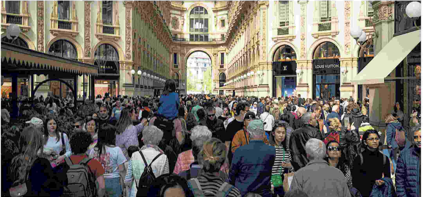
▲ In Galleria il pienone di turisti. Tutto esaurito alla Pinacoteca di Brera e record assoluto al Museo Novecento